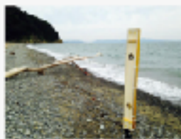
フィールドの音を録る