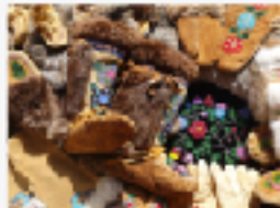
狩猟採集民と動物とアート